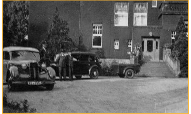
Chauffeure von Rheinmetall am Hauseingang der Villa.

„Von den vielen Besuchern der Villa zur Nazizeit haben wir nicht viel mitbekommen. Es war ja alles sehr geheim. Nur einen habe ich selbst gesehen: Dr. Robert Ley, Reichsleiter. Er stand zwischen seinen großen „Riesen“ auf der Eingangstreppe. Er war so ein kleiner Kerl und sehr dick.“